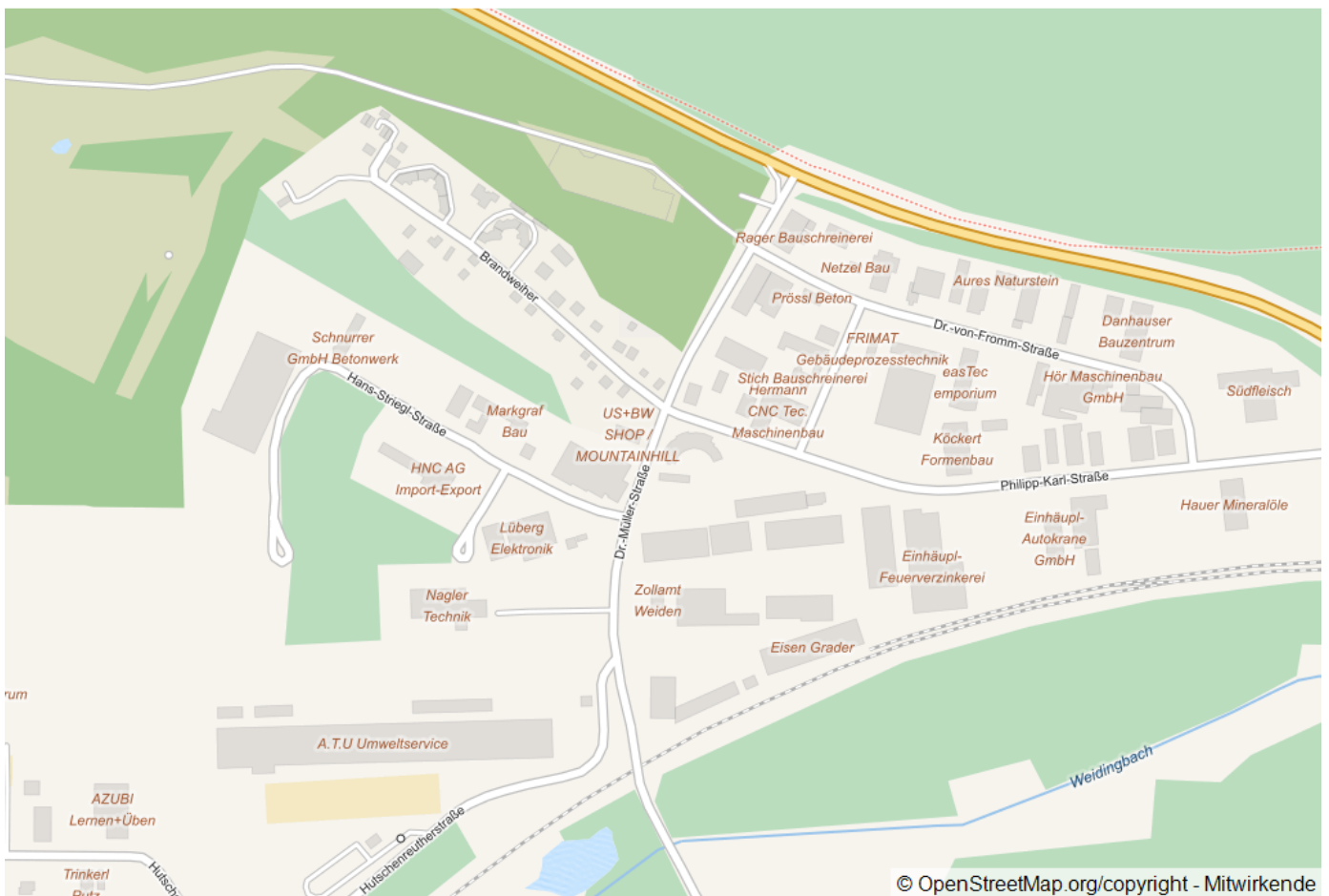
Brandweiher 36, 92637 Weiden in der Oberpfalz

Kaufpreis: 183.000,00 € Wohnfläche (ca.): 85,00 m 2 Zimmer: 3